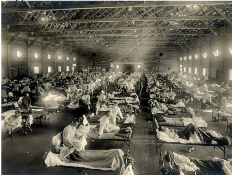
Funston Camp i Kansas 1918

”Flera unga män i Haskell county som känt av influensan inkallades den vintern till Camp Funston i centrala Kansas. Den 4 mars, anmälde den förste rekryten influensasymptom. Den enorma armébasen drillade soldater till kriget i Europa. Inom två veckor lades 1 100 in på basens ”hospital”, med tusentals fler sjuka i kasernerna. Trettioåtta dag. Därefter spreds smittan från Funston till andra förläggningar; 24 av 36 stora arméläger såg utbrott i tiotusentals. Snart skulle de skeppas en masse över Atlanten.”